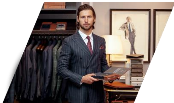
PIŁKARZ I PRZEDSIĘBIORCA